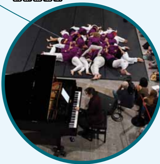
СРЕДИЗЕМНОМОРСКАЯ ЯРМАРКА (стр.27)