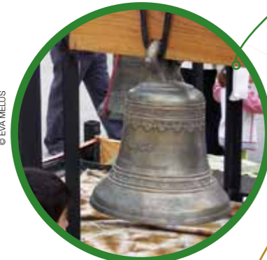
ВСТРЕЧА ЗВОНАРЕЙ (стр.10)