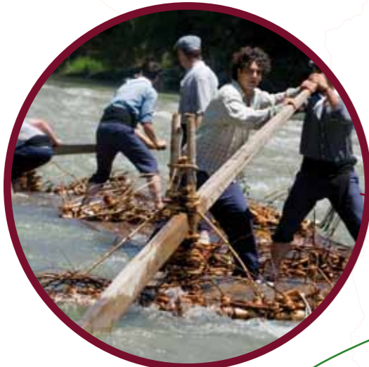
ДЕНЬ ПЛОТОГОНОВ (стр.16)