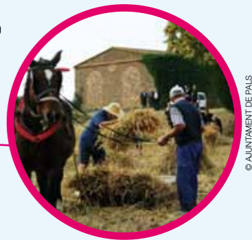
ТРАДИЦИОННЫЙ ПРАЗДНИК ЖАТВЫ РИСА (стр.27)