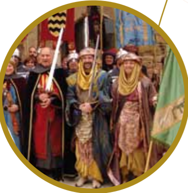
ПРАЗДНИК МАВРОВ И ХРИСТИАН (стр.12)