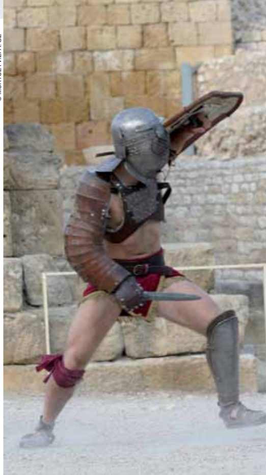
124 ПРЕДСТАВЛЕНИЕ НА ФЕСТИВАЛЕ TARRACO VIVA В ТЕРРАГОНЕ, КОСТА-ДОРАДА.