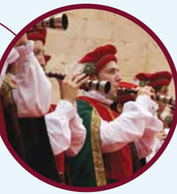
ПРАЗДНИК РЕНЕССАНСА (стр.22)