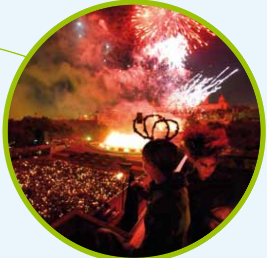
ПРАЗДНИК, ПОСВЯЩЕННЫЙ БОГОМАТЕРИ МИЛОСЕРДНОЙ LA MERÇE (стр.25)